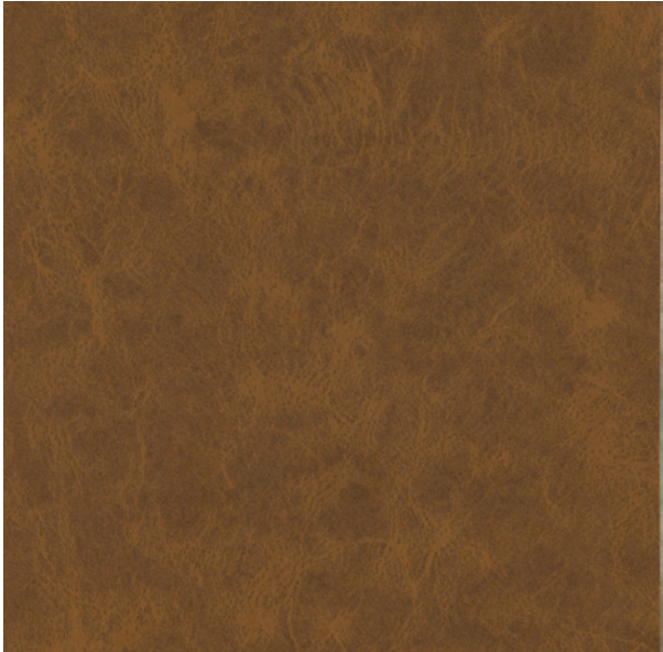
335 x 4681