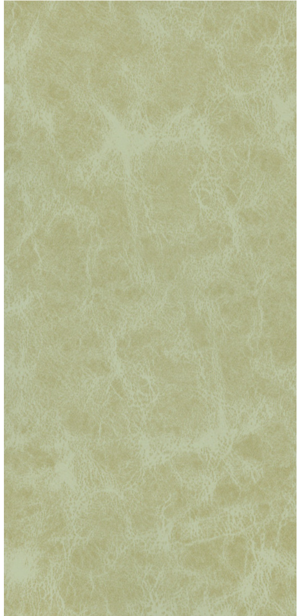
335 x 4679