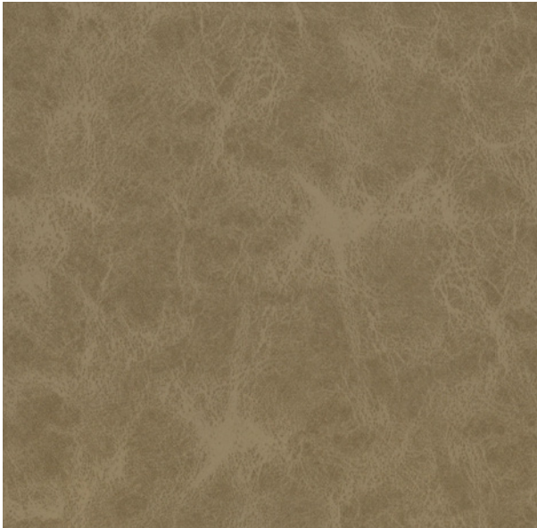
335 x 4680