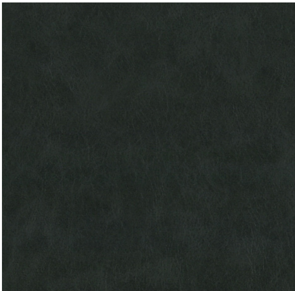
335 x 4684