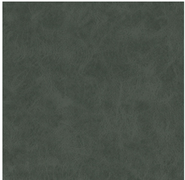
335 x 4957