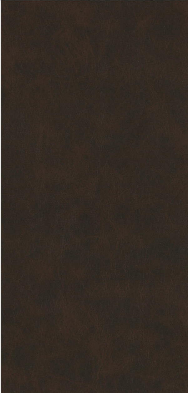
335 x 4682