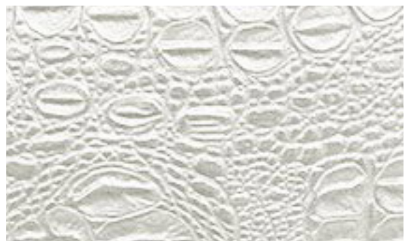
224 x 3097