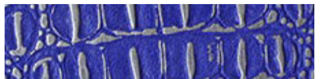
224 x 3028