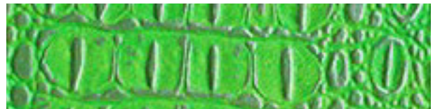
224 x 3025