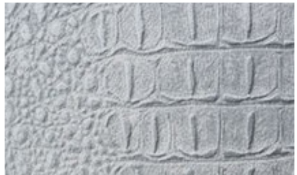
224 x 3029