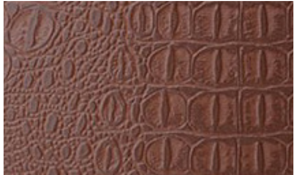
224 x 4286