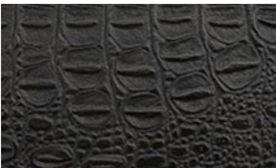
224 x 4288