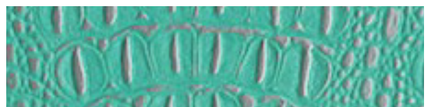
224 x 3027