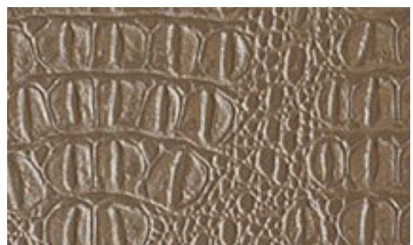
224 x 4280