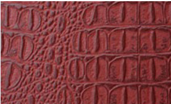
224 x 4285