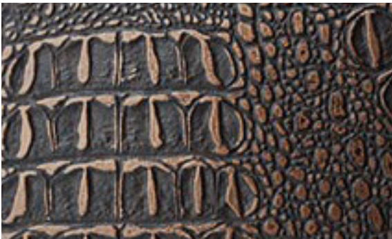
224 x 3033