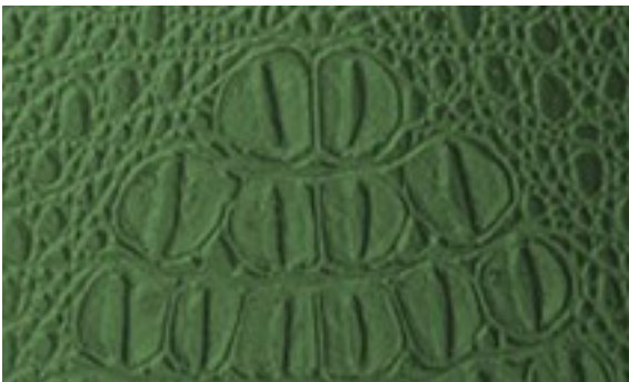
224 x 4284