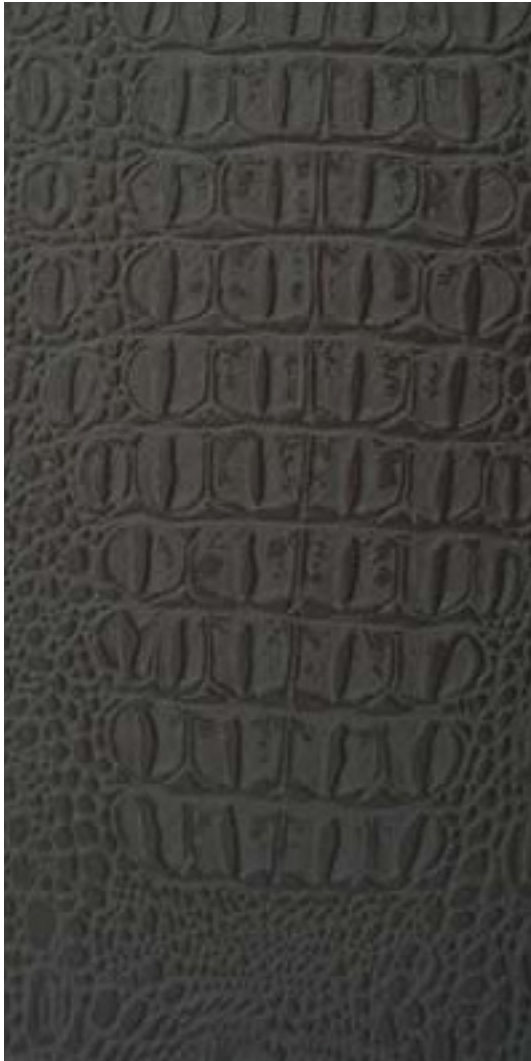
224 x 4287