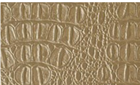
224 x 4281