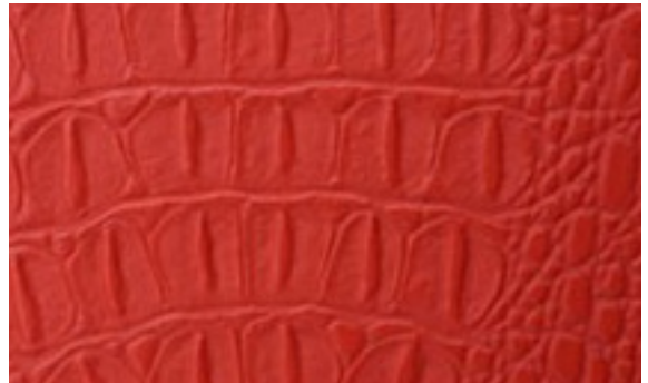
224 x 3098