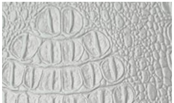
224 x 3030