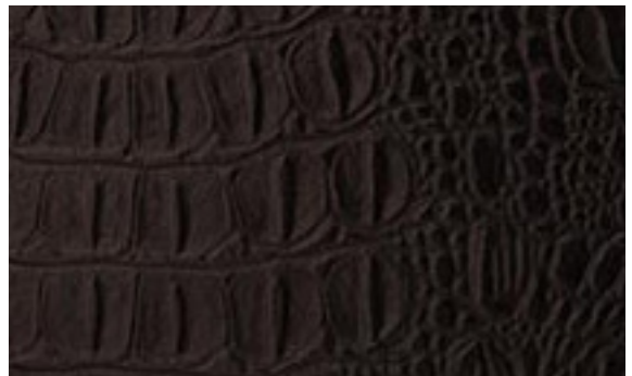
224 x 3032 dunkelbraun dark brown