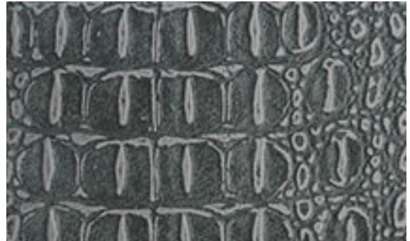
224 x 3031